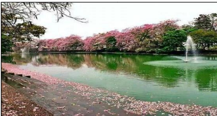
Laguna de las Ilusiones, Villahermosa, Tab.