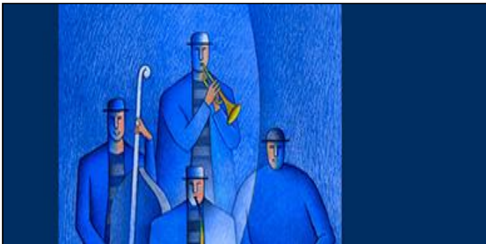
Festival "Tabacalera Jazz Club" / México, D.F.