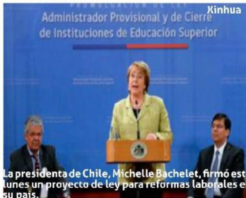
La presidenta de Chile, Michelle Bachelet, firmó este lunes un proyecto de ley para reformas laborales en su país.

La normativa se envió al Congreso y fue discutida y aprobada por los legisladores de la Nueva Mayoría (partido gobernante), que apoyaron el propósito de Bachelet, fundamentado en ofrecer los beneficios justos a los trabajadores.