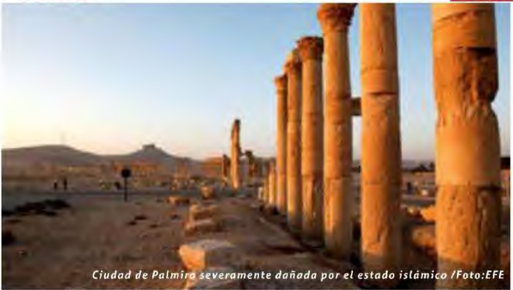
Ciudad de Palmira severamente dañada por el estado islámico